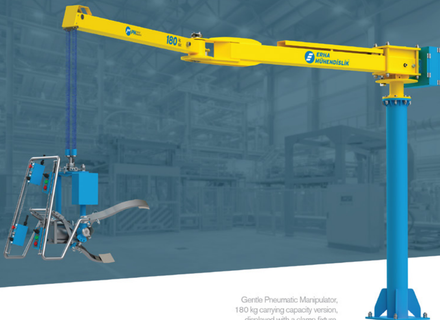
Gentle Pneumatic Manipulator, 180 kg carrying capacity version, displayed with a clamp fixture.

Пневматические манипуляторы Gentle предназначены для перемещения грузов, ориентированных на оператора, в пределах рабочей зоны с минимальными усилиями. Он уравнивает вес груза, позволяя оператору быстро и безопасно переносить груз.